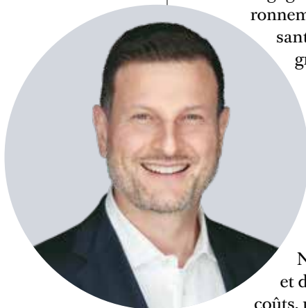
Fabrice Moscheni Député au Grand Conseil vaudois (UDC)

F.M. : Le médecin restera une figure centrale, mais son métier évoluera profondément : moins d'administratif, davantage de supervision, de décision et de relation humaine. La profession devra être revalorisée, faute de quoi la Suisse manquera durablement de médecins et peinera à susciter des vocations.